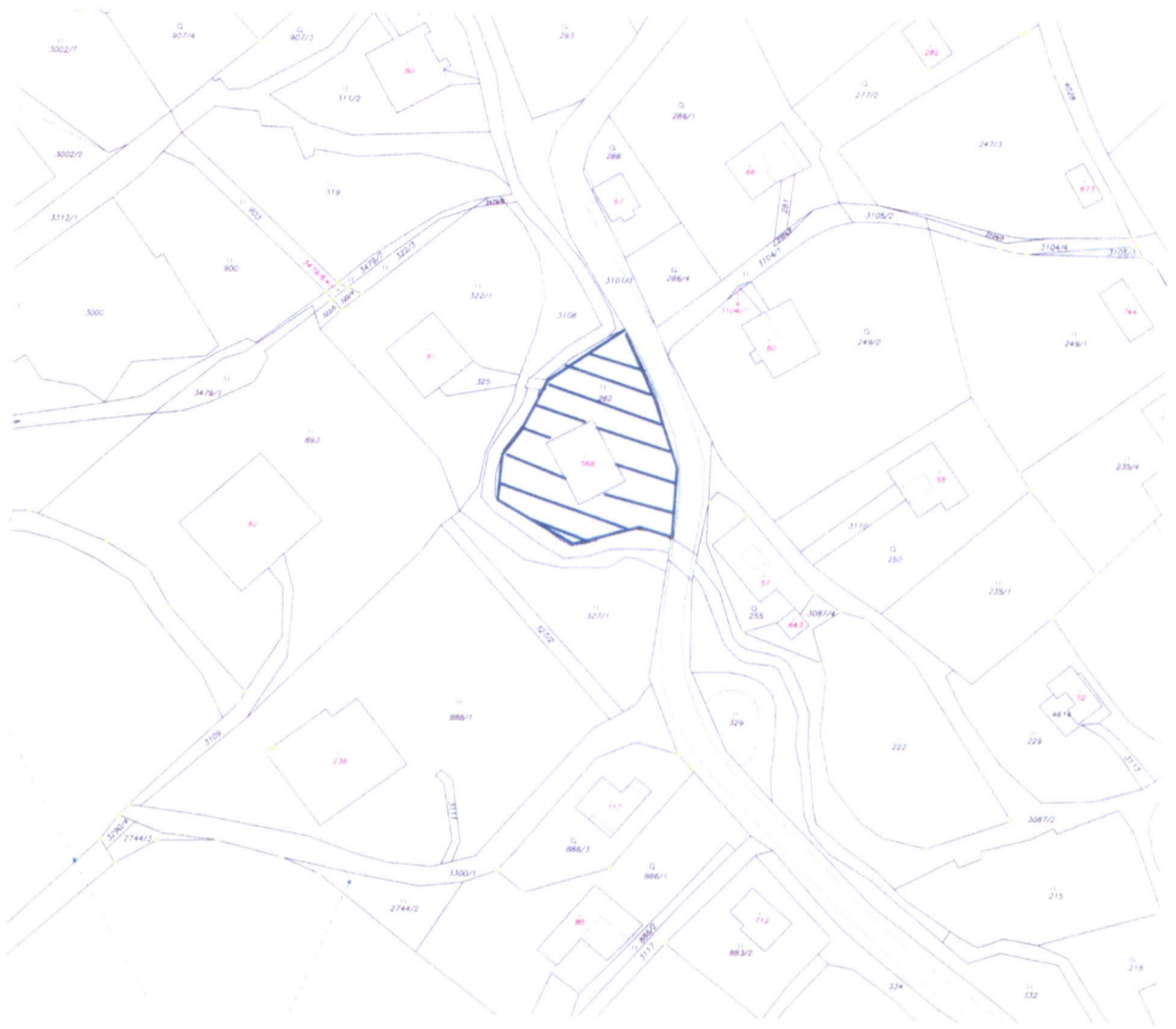
prostranství v okolí bytového domu čp. 261