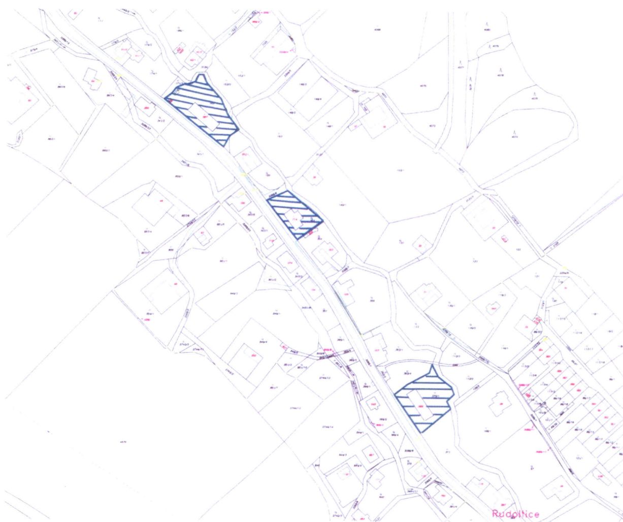
prostranství v okolí bytových domů čp. 263, 262 a 276